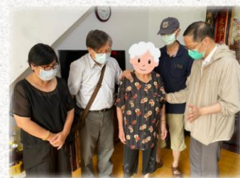
至偶像崇拜盛行的野柳探訪居民，願主的平安按在他們心上