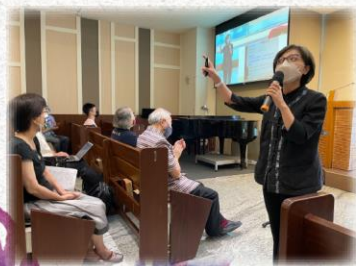
昆牧至和平教會介紹迦拿事工，邀請弟兄姊妹一起關懷泰國移工

世光獎助學金 ，一直是支持努力向學及家境清寒學子的重要事工。一年兩度的發放，看似微小卻扶持了許多孩子，尤其2022年我們改變方式，邀請獲得獎助學金者進入教會受獎。讓教會的會友可以認識這些孩子，多關心這些孩子，更重要的是，有的清寒的孩子藉著獎助學金的機會進到教會，都是福音的撒種的好機會！若您親眼看見這些孩子因著獎助學金，第一次全家一起走進教會做禮拜，我想您會感動地明白，這不只是一筆獎助學金而已！